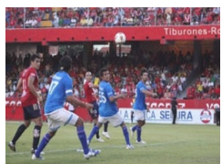
Intención de venta del San Luis llevaría Liga MX a Veracruz