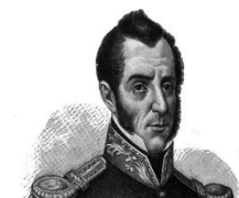
Recuerdan en spot a primer gobernador veracruzano