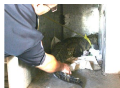
Capturan a Cocodrillator en Puerto de Veracruz